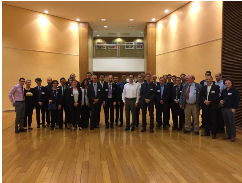
Graphique 2. La réunion des économistes des ANC le 1er juin 2017 à Bruxelles